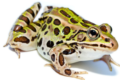
La grenouille léopard

Les femelles pondent dans l'eau des œufs qui se transforment en têtards. Ils respirent avec des branchies comme les poissons, puis deviennent des grenouilles et possèdent des poumons et respirent aussi par la peau. Le têtard naît avec une petite queue lui permettant de nager, celle-ci disparaîtra quand ses quatre pattes auront poussé.